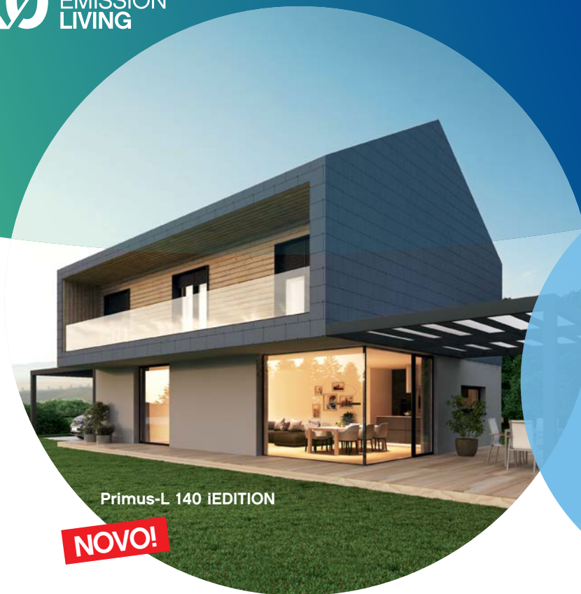
Primus-L 140 IEDITION